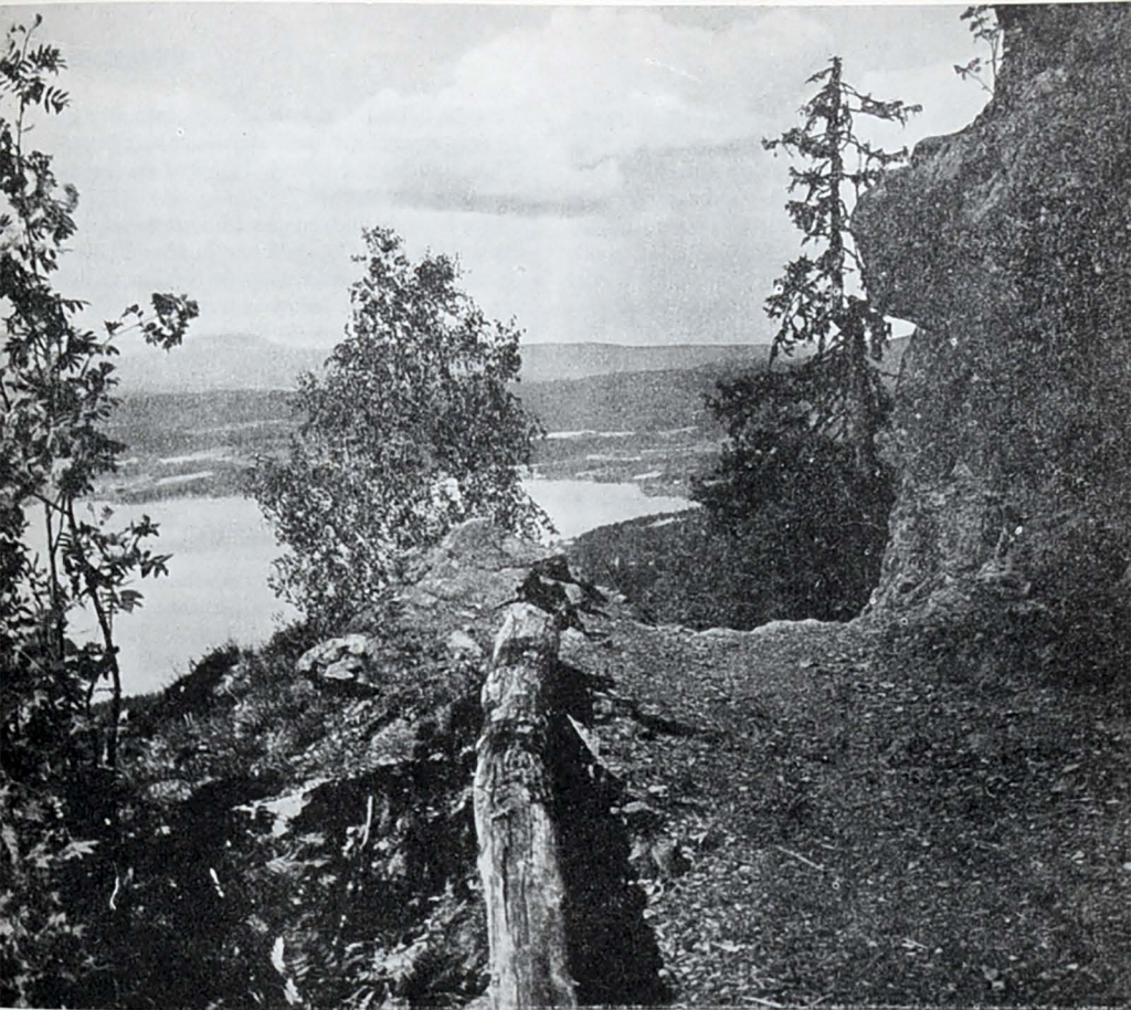
Utsikt over Steinsfjorden mot Asa.