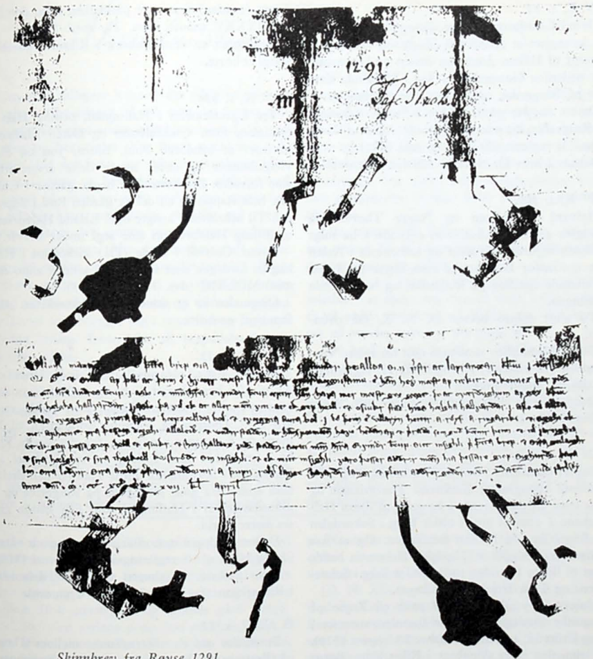
Skinnbrev fra Røyse 1291.