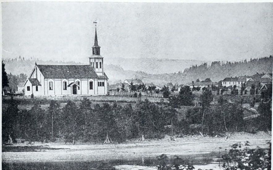
Honefoss Kirke ca. 1890.

den — enkelte særlig flinke kunne kanskje oppnå 12—15 kroner — men det ble regnet for en meget høy lønn.