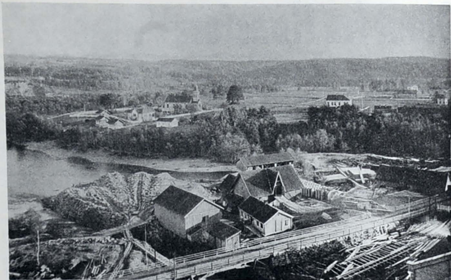
Parti fra Hønefoss Bru ca. 1900.

skyssgutter i arbeide, og så naturligvis alle de handlende. Dessuten var det om sommeren beskjeftiget ikke så få mann i flotningen — eller brøtningen, som vi kalte det, — og om vinteren var det isskjæring oppe på Molvald. Is var en nødvendighetsartikkel. Elektriske kjøleskap eksisterte jo ikke, så de mere velstående familier hadde iskasser, som trengte ukentlig forsyning. Flere bedrifter, først og fremst bryggeriet, og endel forretninger måtte også ha is. De store blokkene ble oppbevart i sagflis for å holde seg til de skulle tas i bruk om sommeren.