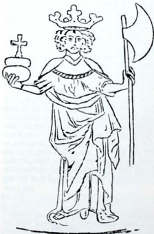
Olavsbilde fra 1200-tallet på kirkeklokken i Moster kirke.