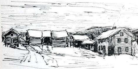
Illustrasjon av Oivind Fjeldstad.

Som nu sitter der i vevstolen hører a gjen- nom slaga av veven, slaga av slira has Lars, han driver og tresker rugen bortpå läven, imor- ra ska'n vel te mølla og mala, så itte brød- mjølet blir altfor ferskt te jul. Flatbrød har dom alt bakt, tre høye stabler, så det gredde seg nok te våren. Det skulde nå vøri morro å prøve seg og stekt slik goro-kake te jul, og kanske fattigmand og, hu fekk nok opskrift bortpå Bye, men det var vel itte så godt å byne med no nytt. — A, om a kunne fått slik kåpe som prestefrua hadde ifjor, men det var nå itte å tenke på, hu fekk nok gå med sjalet nå som før. Dom fekk nok spare på stasen, det kunne ha så my å seia for dom om dom kunne få innredd no mer av stuehuset. Det var itte store hjelpa i en diger byning med ufærige rum. — «Nei, nå var det meddan», det var nok slid idag, en måtte spare på sugla nå før slaktinga.