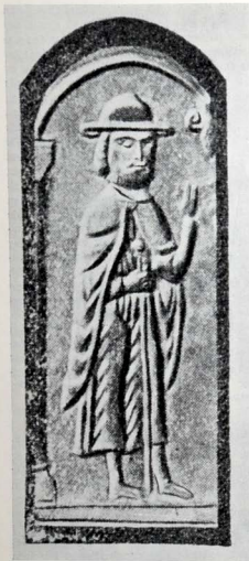
Pilgrim avbildet på relikvieskrin i Hedalskirken i Valdres.

delige mål for de fleste, men det var meget alminnelig å ta avstikkere underveis til steder der Olav hadde ferdes. For norske pilegrimers vedkommende kan det også godt tenkes at Ringerike var det endelige mål for ferden. I våre gamle lover er der bestemmelser om pilegrimene, at de skal tas vel imot der de kommer og hjelpes på alle måter.