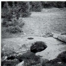
St. Olavs brønn ved Retelseter.

Vi har hatt vanskelig for å forsone oss med denne verdslige forklaring når det gjelder disse stedene som har fått Olavsnavnet knyttet til