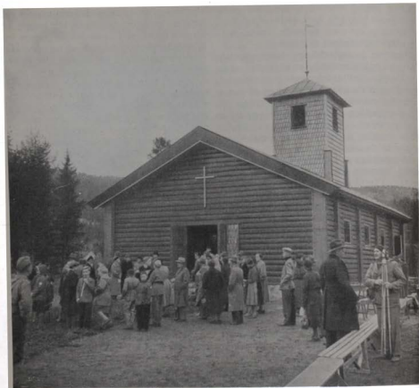
Mange folk samler seg foran Strømsodbygdas kapell.