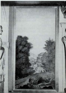
Jaktslottet ved Stubdal.