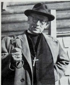
Biskopen ved kirkedøra med den historiske nøkkelen.

Den 5. oktober 1957, en lørdag kl. 17,00, lød det bud om høytid i Strømsodbygdas. Den varme og rike klangen fra kirkeklokken som har denne innskripsjon «Gud til ære — gjennom skogenes stillhet», fylte bygda.