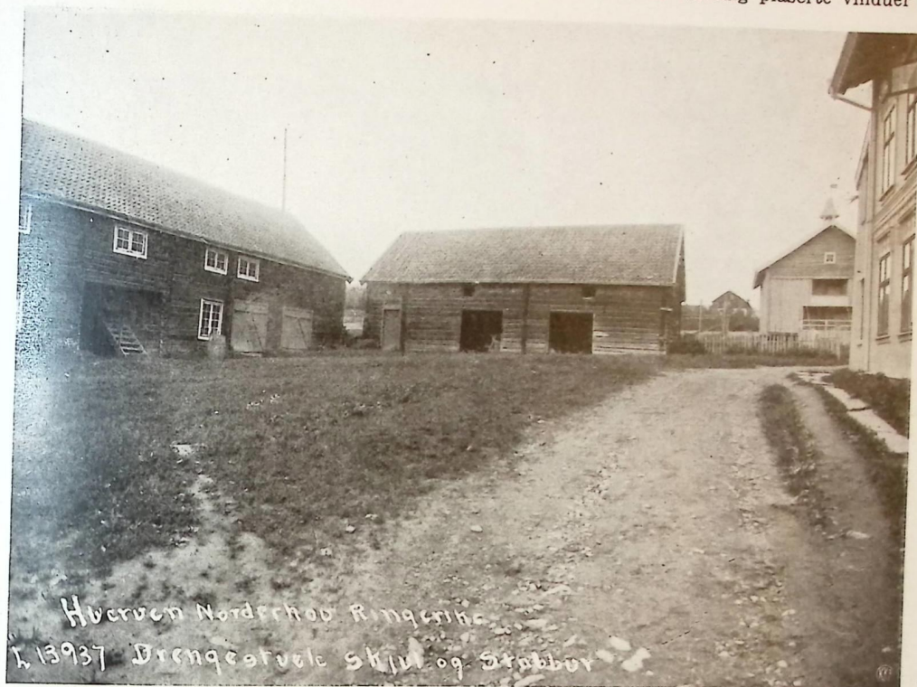
„FOLKETUNET“ PÅ HVENVEN I NORDERHOV

gangsportaler, og den er også forsynt med små, enkle pilastre. Det er god grunn til å tro at bygningen har hatt svalgang i annen etasje på hovedfasaden. De små tilfeldig plasserte vinduer i