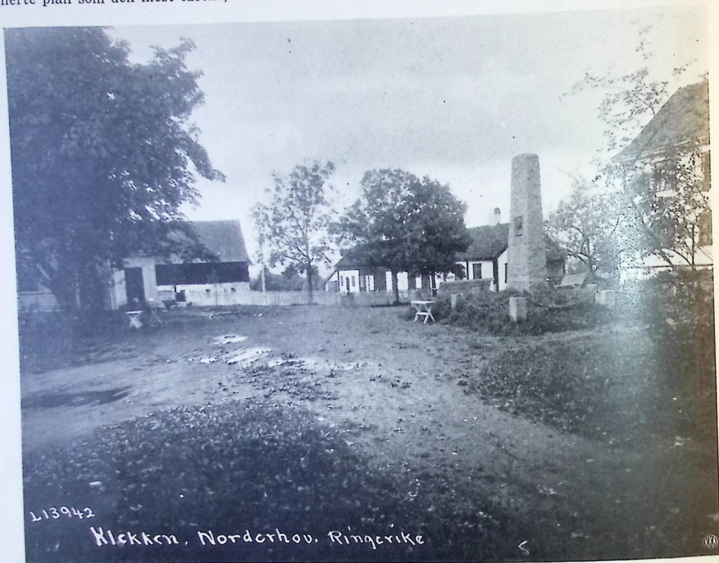
TUNENE PÅ KLEKKEN I NORDERHOV

Norderhov. På nordsiden, og baksiden, av hovedbygningen ligger parallelt med denne et tømret toetasjes hus med en imponerende lengde som inneholder en rekke rum. Disse to hus og et stort