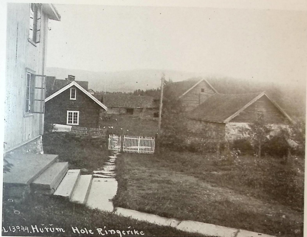
TUNET PÅ HURUM I HOLE. HOVEDBYGNINGEN TILVENSTRE

På samme måten som med gårdsplanen vil man også i de enkelte hus finne at det er forskjell