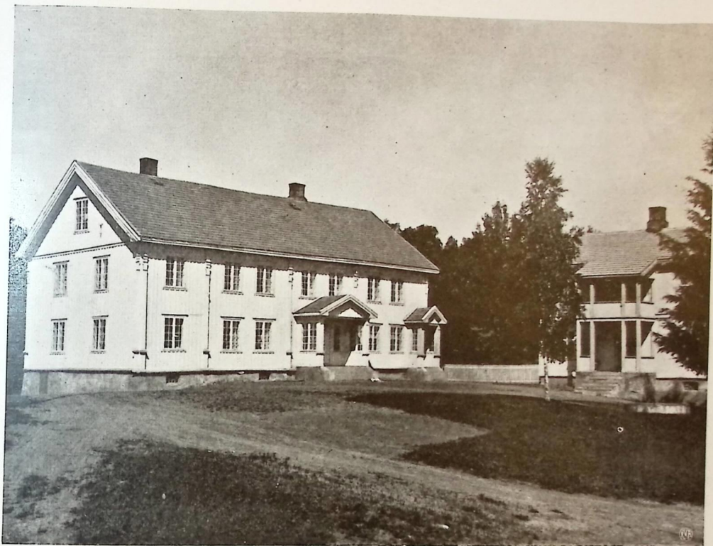
HOVEDBYGNINGEN PÅ HESLEBERG NORDERHOV, OPFØRT 1771