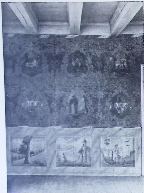
INTERIØR AV STORSTUEN PÅ VAKER NORDERHOV