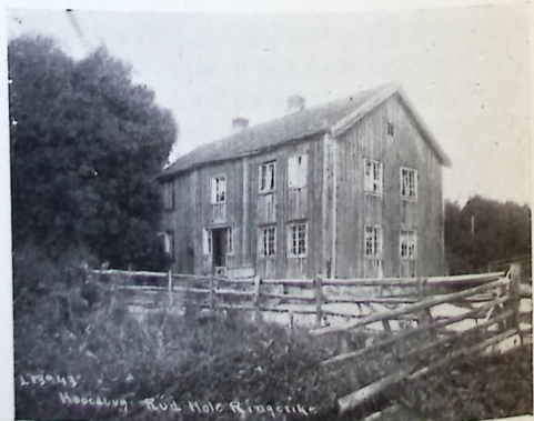
HOVEDBYGNINGEN PÅ RUD I HOLE

Hus med åpne svalganger hører nu mere med til de sjeldne typer. Det er derfor litt av en overraskelse å se et slikt vel bevart toetasjes hus på Ringerike. Den gamle hovedbygningen på Øvre Lundesgård i Lunder, bygget i 1700-årene, har åpen svalgang i begge høider.