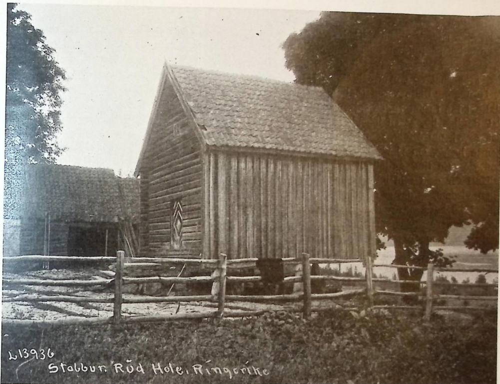
STABBURET PÅ RUD I HOLE

rier. Det er meget av barokkens kraft og stemning over dette rummet — ikke bare i farvene, men også i den store brandmuren, midt på tverveggen, med sine profiler.