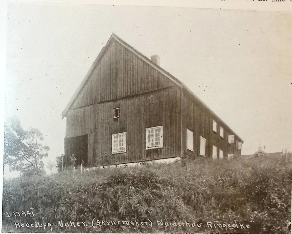
HOVEDBYGNINGEN PÅ VAKER I NORDERHOV

Forskjellige forhold gjør at det her ikke er