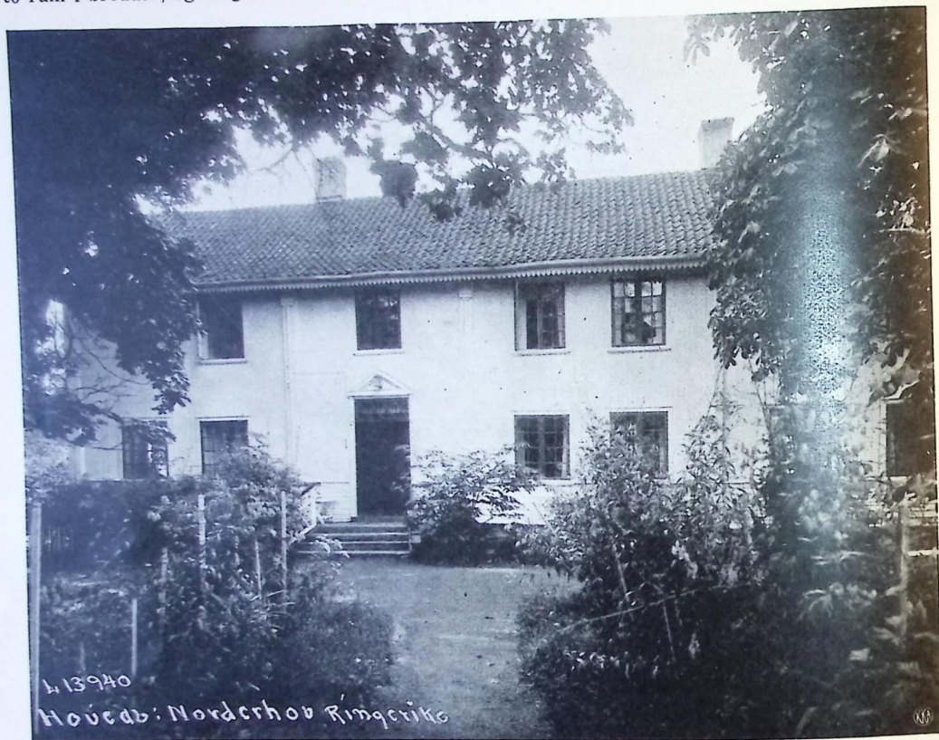
HOVEDBYGNINGEN PÅ KLEKKEN I NORDERHOV

forhistorisk tid — huset har en meget lang historie. På Søndre Somdal står en slik stue med sperretak og årstallet 1760, omtrent fra samme tid er stuene på Nordre Ramberget og