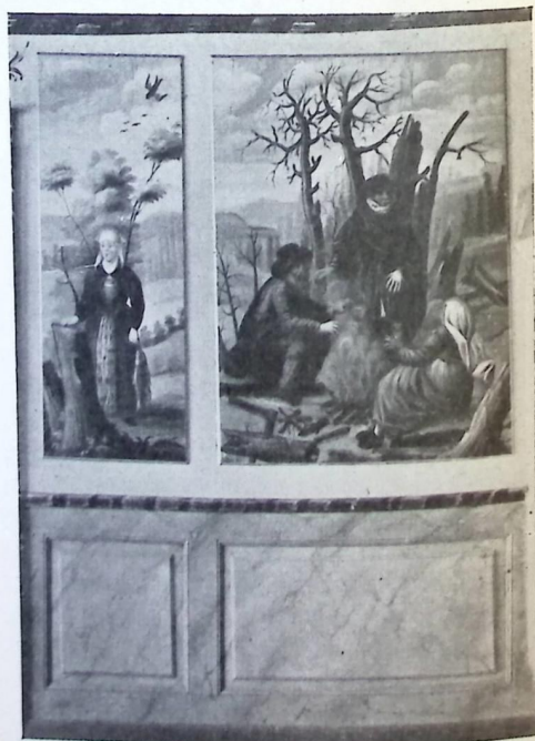
INTERIØR AV STORSTUEN PÅ HESLEBERG NORDERHOV

En av de første større oppgaver Adnes fikk var sannsynligvis å male storstuen og spisestuen for sorenskriver Leth (?) på Skriver-Vaker. Hele tegne- og malemåten tyder på at dette arbeide er gjort en god stund før heslebergbildene. Tegningen er litt kantet og ubehjelpelig og malemåten noget broket. Til å fylle alle brystpanelingens felter med i spisestuen har han brukt borger og slott, malt på lysblå bunn. I storstuen hvor det er sjablonerte, håndmalte tapeter over brystpanelet er feltenes motiv mest fantasilandskaper. På et av feltene er det malt en karjølsskys i en bratt bakke hvor en dame på en ganske komisk måte faller med full fart ut av setet. Tradisjonen