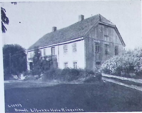
HOVEDBYGNINGEN PÅ LIBAKKE I HOLE

ser en rekke gode rum med vakre detaljer på veggpanelets ramverk, dører, dørbeslag og listeverk.