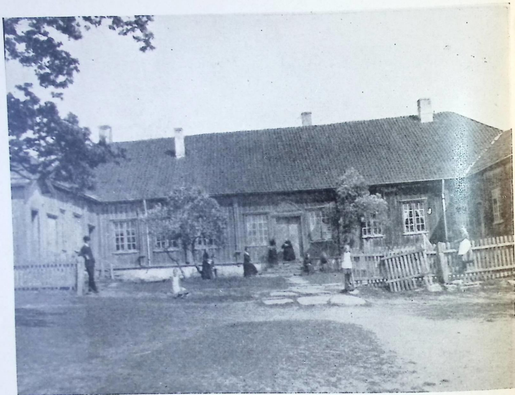
HOVEDBYGNINGEN PÅ RÅ I NORDERHOV. BRENDT 1892

drev Fienden tilbake, hvoraf de altid havde Forraad paa Svalene, saa at saadanne Bygninger tjente dem som en Fæstning». Dette må ha vært et hus omtrent av samme sort som Handeloftet